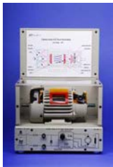
EM-3350-1D Motor DC Bobinado de Derivación