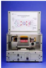
EM-3350-1A Motor DC Magnético Permanente

Los modelos vista en corte están hecho por máquinas eléctricas normales. Se corta 1/4 por ciento de longitud del estátor para una visión óptima de la construcción interior de la máquina, que también puede seguir funcionando. La superficie de la máquina está protegida contra la corrosión.