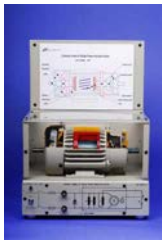
EM-3350-1C Motor de inducción monofásico