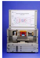
EM-3350-3C Motor Trifásica de Jaula de Ardilla