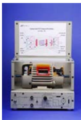
EM-3350-1F Motor DC Compuesto de Bobina

Nota: Transformador de sistema proviene una carga extra para las áreas donde la potencia 220V trifásica no está disponible.