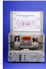
EM-3350-3A Motor Síncronico de Polo Saliente Trifásica