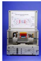
EM-3350-3B Motor Trifásica de Rotor Bobinado